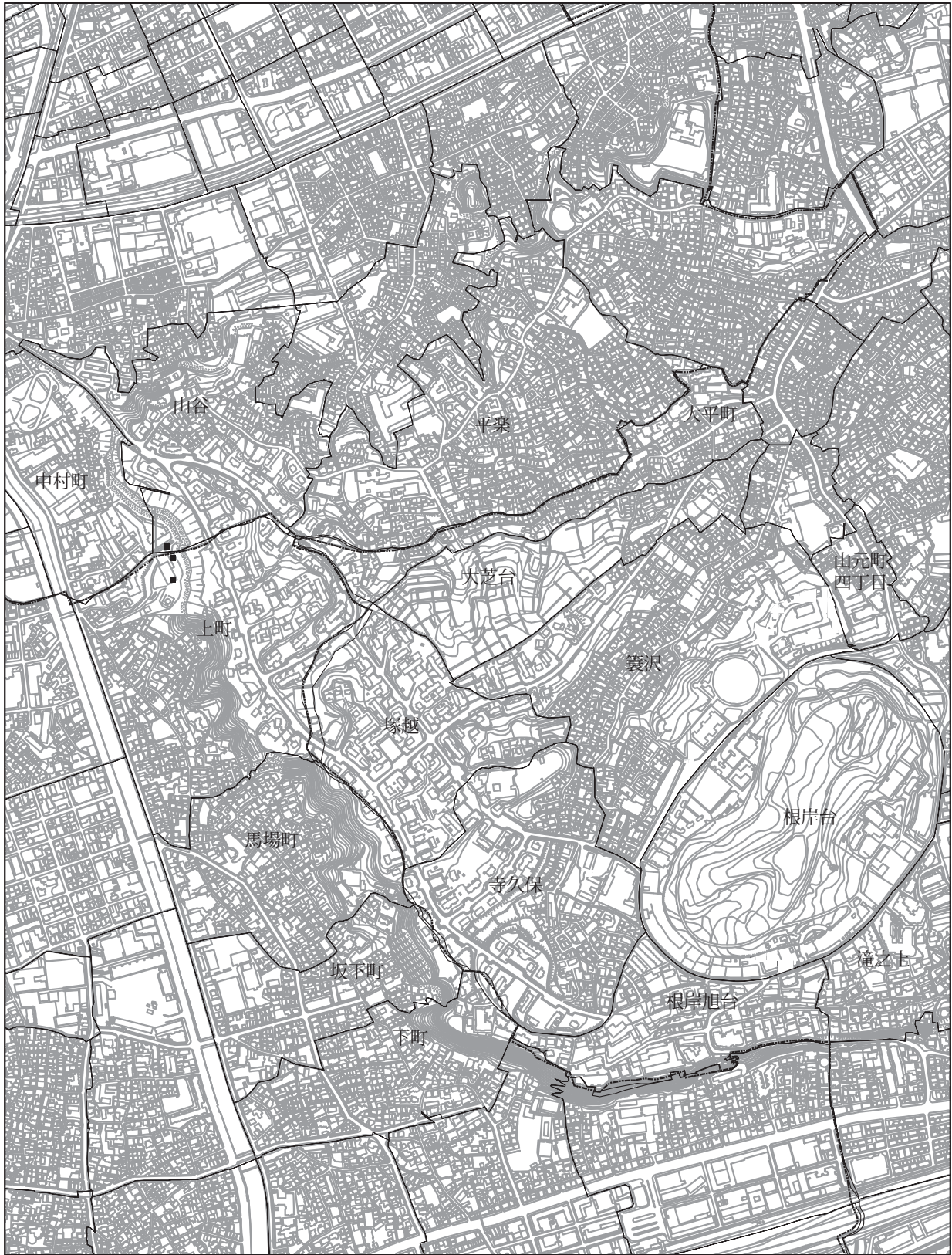
横浜市建築局都市計画基本図データにより作成【横浜市地形図複製承認番号 平31建都計第9008号】